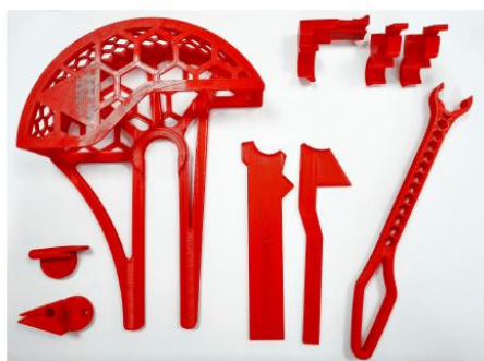
Vue d'ensemble des outils, impression 3D avec du filament PLA rouge